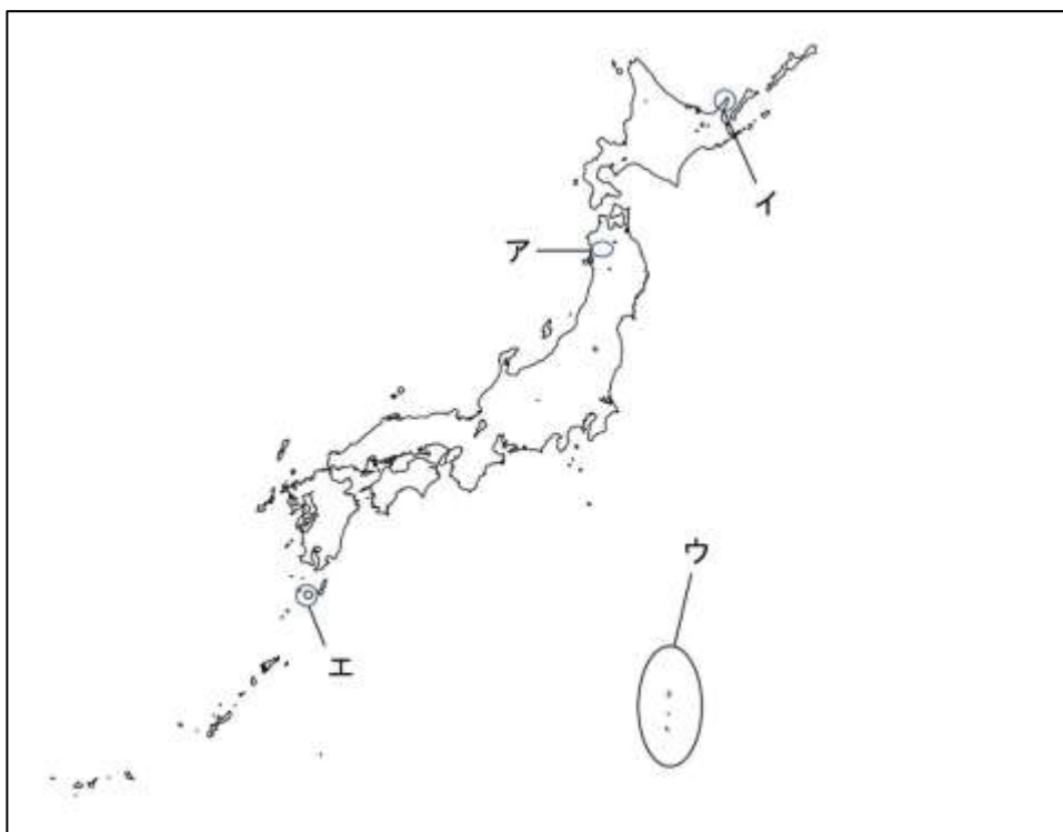
「ハイマップマイスター」にて作成

(4) ドイツは、世界遺産の数が全部で46あり、世界で5番目の数を誇ります。そのうち、世界自然遺産に「カルパティア山脈のブナ原生林とドイツの古代ブナ林群」があります。日本でも、人の影響をほとんど受けていない世界最大級の原生的なブナ林が、世界自然遺産に登録されています。その遺産にあてはまるものを、地図中のア～エから1つ選び、記号で答えなさい。