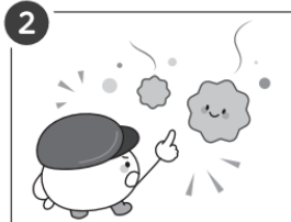
2 見張り役の細胞が花粉を「異物」と認識