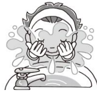
外から帰ったらうがい&洗顔

上の表にもあるように、 花粉症とかぜの症状は非常に良く似ています 。しかし、風邪は、4~5日で症状が軽快していきませんが、花粉症は、なかなか辛い症状が軽快しません。 「鼻水、くしゃみ、咳」の症状が1週間以上続く時は、症状を放置せず、医療機関できちんと診断してもらうようにしましょう。