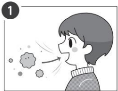
1 花粉が体に入ってくる