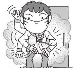
玄関で花粉を落とす