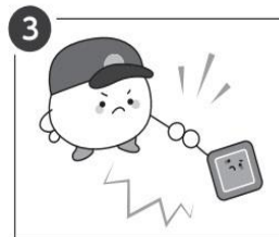
3 花粉再来時にすぐ反応できるよう Ige 抗体を作り、準備する