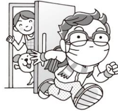
外出時はメガネとマスク着用